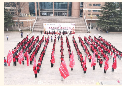
学雷锋志愿服务活动启动仪式

为深入贯彻落实党的二十大精神，大力弘扬“奉献、友爱、互助、进步”的志愿服务精神，持续推进学雷锋志愿服务制度化