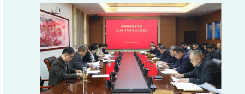
我校召开2024年普通高校专升本考试工作会

3月26日上午，我校2024年专升本工作会议在信息图文中心404会议室召开，校领导班子全体成员出席会议，校全体中层干部参加会议。