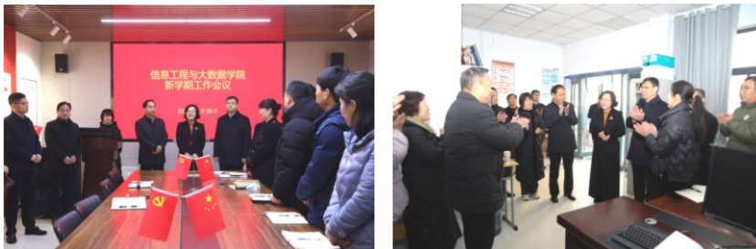
看望慰问信息工程与大数据学院教职工

龙年共奋进，携手绘新篇。2月28日，开学报到首日，校领导党委书记吕村、党委副书记、校长潘维成携校领导班子全体成员深入各二级学院看望慰问一线教职工，调研了解新学期开学准备工作，并向大家致以新年的祝福和新学期的问候。