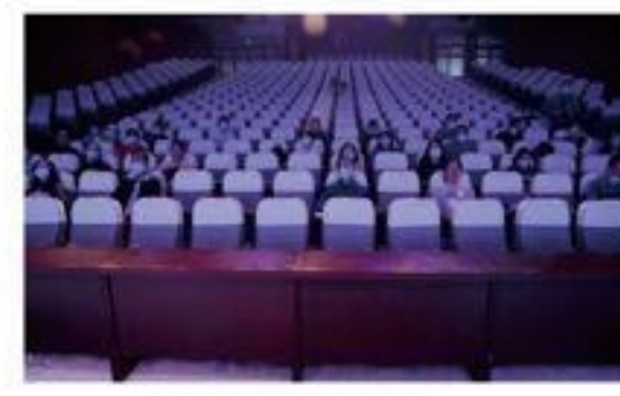
参训教师认真观看直播视频

根据教育部教材局《关于做好高校思想政治理论课2021版教材使用培训的通知》，切实帮助思政课教师更好地把握教材的基本精神和主要内容，我院思想政治理论课教学部结合学院疫情防控要求，设高校分会场，认真组织思政课教师在学术报告厅集