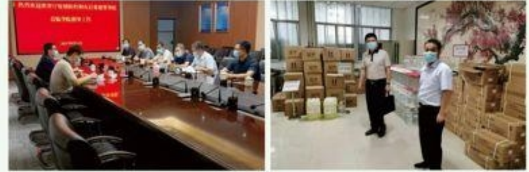
督导组在临院督导检查