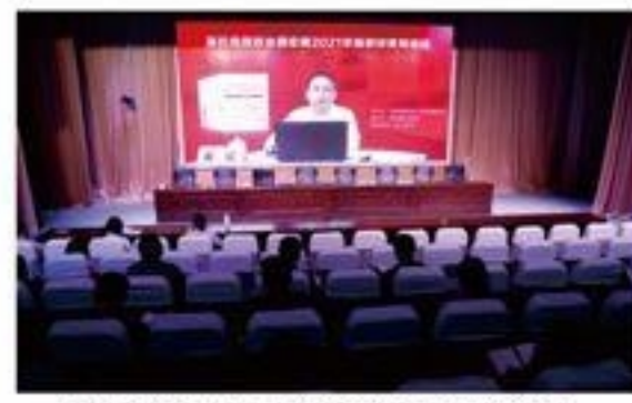
我院组织收看高校思想政治理论课 2021版教材使用培训视频直播