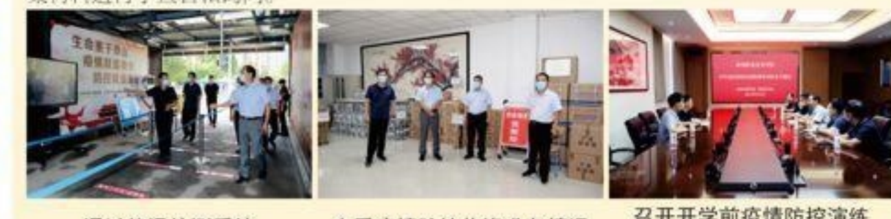
通过体温检测系统 查看疫情防控物资准备情况 召开开学前疫情防控演练暨督导检查专题会议

本次演练采取情景模拟和现场演练相结合的方式，模拟了开学后学生入校、入住宿舍、上课学习、食堂就餐等多个场景的准备工作，并详细了解了开学前的准备工作。督导组一行到我院学生源地组成情况、当前防疫物资准备及受灾情况、当前疫情防控和灾后重建工作。督导组一行到我院学生源地组成情况、当前防疫物资准备及受灾情况、当前疫情防控和灾后重建工作。