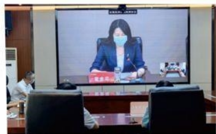
学院领导班子集中收看全省视频会议