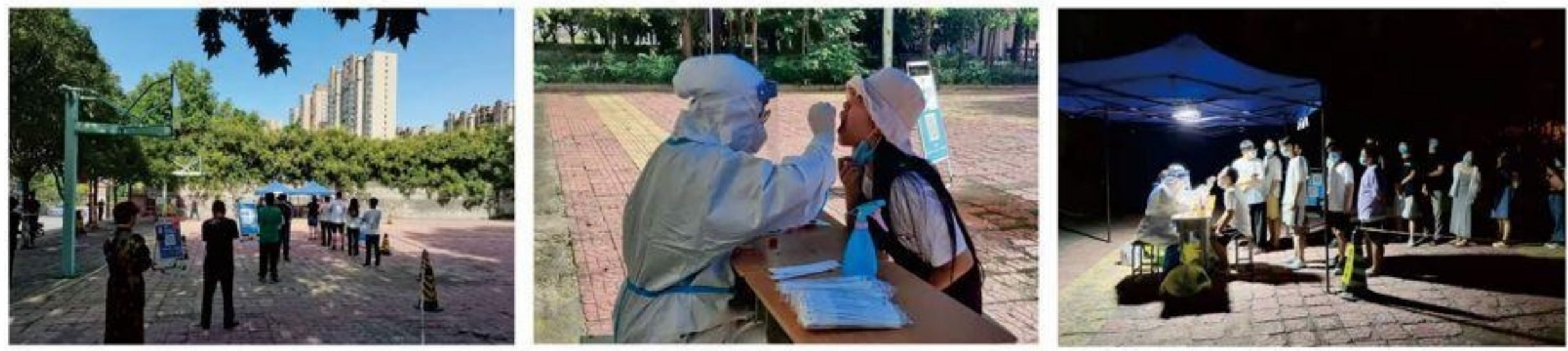
待检师生保持距离