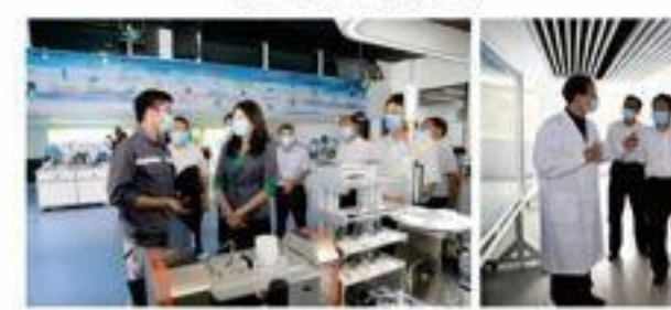
霍副省长在工业机器人工程实训中心调研