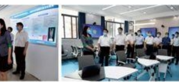
霍副省长在工业机器人工程实训中心调研

8月18日上午，省政府副省长霍金花到我院调研指导疫情防控和灾后重建工作。省政府副秘书长尹洪斌、省教育厅负责同志、省政府办公厅七处等相关负责同志参加调研。院党委书记苗晋琦、院长薛培军等院领导和相关职能部门负责人陪同调研。