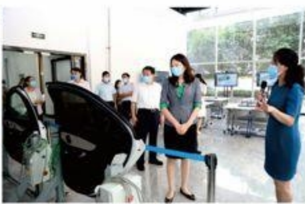
霍副省长在汽车维修实训中心调研