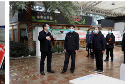
检查学院餐厅疫情防控工作的