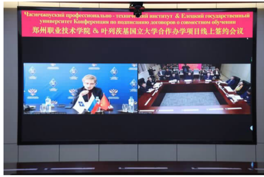
线上签约仪式现场