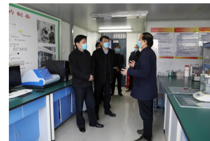
实地察看河南省生物工程技术研究中心