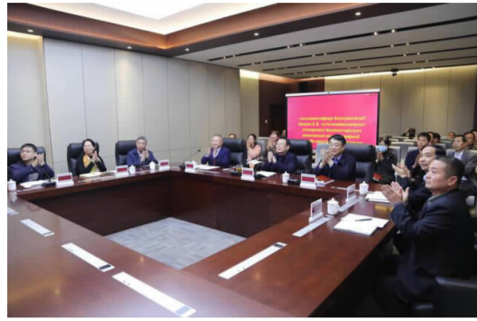
线上签约仪式现场

2021 年 3 月 24 日下午, 我院与俄罗斯叶列茨基国立大学中外合作办学项目协议线上签署仪式在我院图文信息楼 506 会议室举行, 双方校级领导、相关处室及职能部门负责人参加签约仪式。