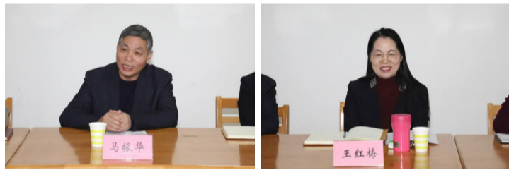
院工会代表现场分享交流