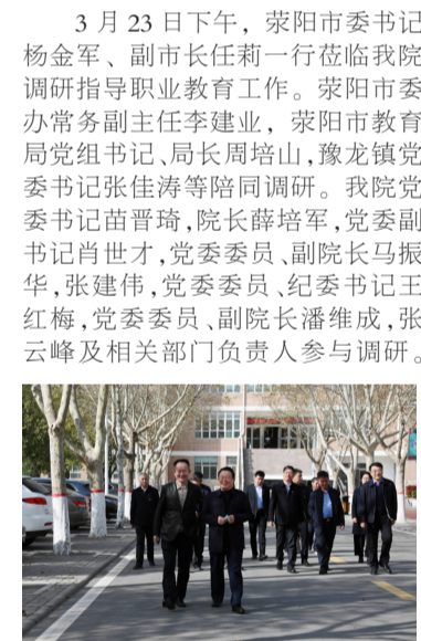
荥阳市委书记杨金军一行莅临我院调研指导工作