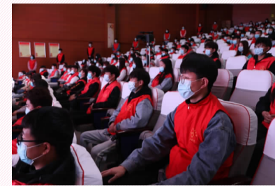
各系志愿者代表按照疫情防控要求参加启动仪式