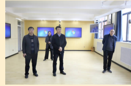
校领导在智慧教室督导检查和指导工作