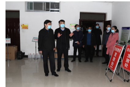
检查学院防疫物资储备情况