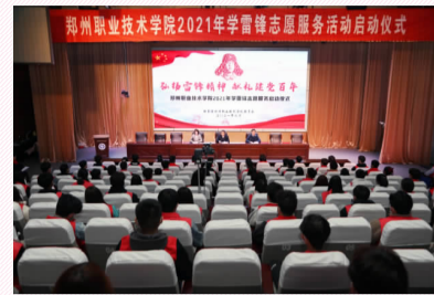
我院 2021 年学雷锋志愿服务活动正式启动