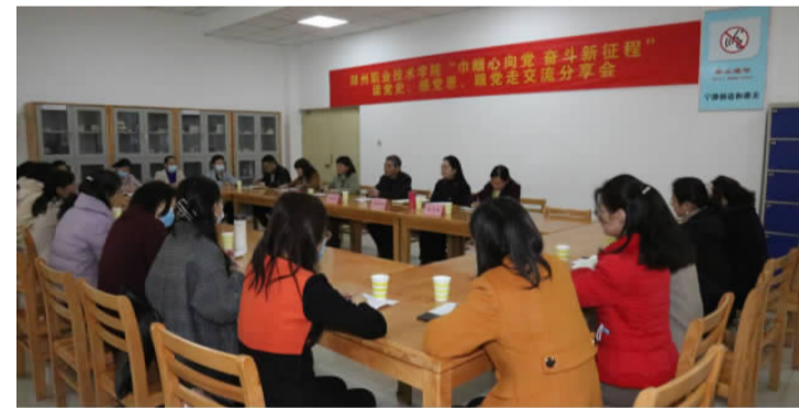
院工会代表现场分享交流

为庆祝中国共产党建党 100 周年, 纪念第 111 个“三八”国际妇女节, 丰富我院女职工的思想文化生活, 3 月 9 日上午, 院工会组织了“巾帼心向党 奋斗新征程”为主题的“读党史、感党恩、跟党走”交流分享会。院党委委员、副院长马振华, 党委委员、