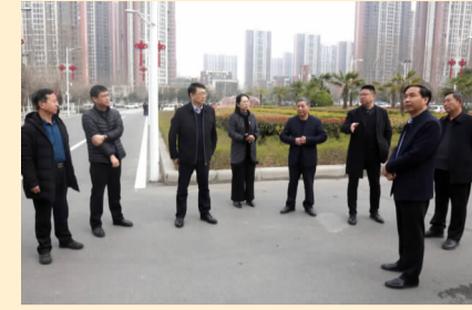
校领导在北大门口督导检查和指导工作